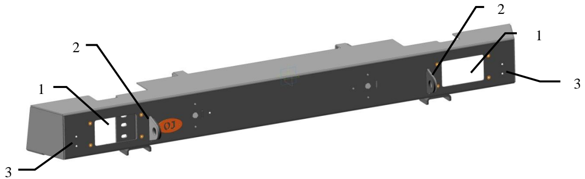
Рис.1 Бампер вид спереди

Возможные комплектации: ОJ 03.125.NN, где NN число от 01 до 99.