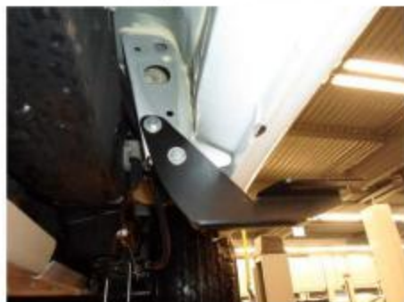
Рис.4 Установка кронштейна в задней части порога автомобиля.