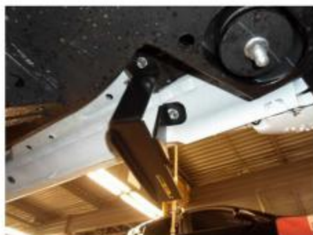
Рис.2 Установка кронштейна в передней части порога автомобиля.