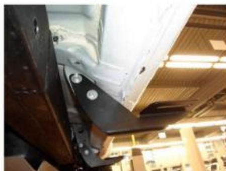
Рис.3 Установка кронштейна в средней части порога автомобиля.