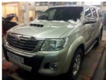
Рис.5 Вид автомобиля с порогом