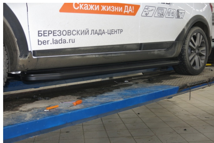
Общий вид автомобиля с порогом