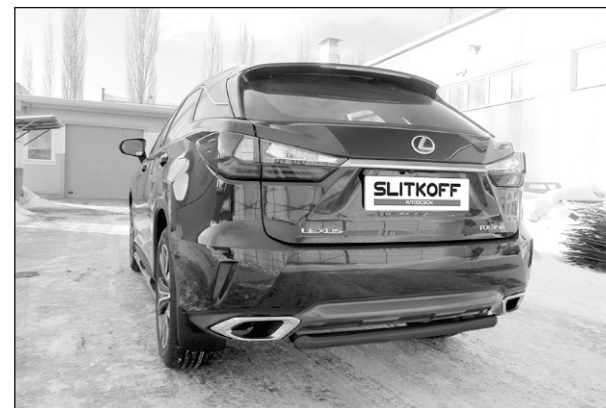
LRX15-007B Защита заднего бампера D57 короткая