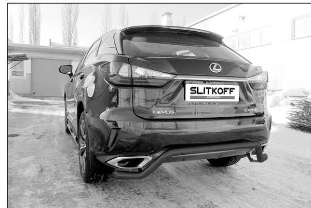
LRX15-006B Защита заднего бампера D57 «Волна»