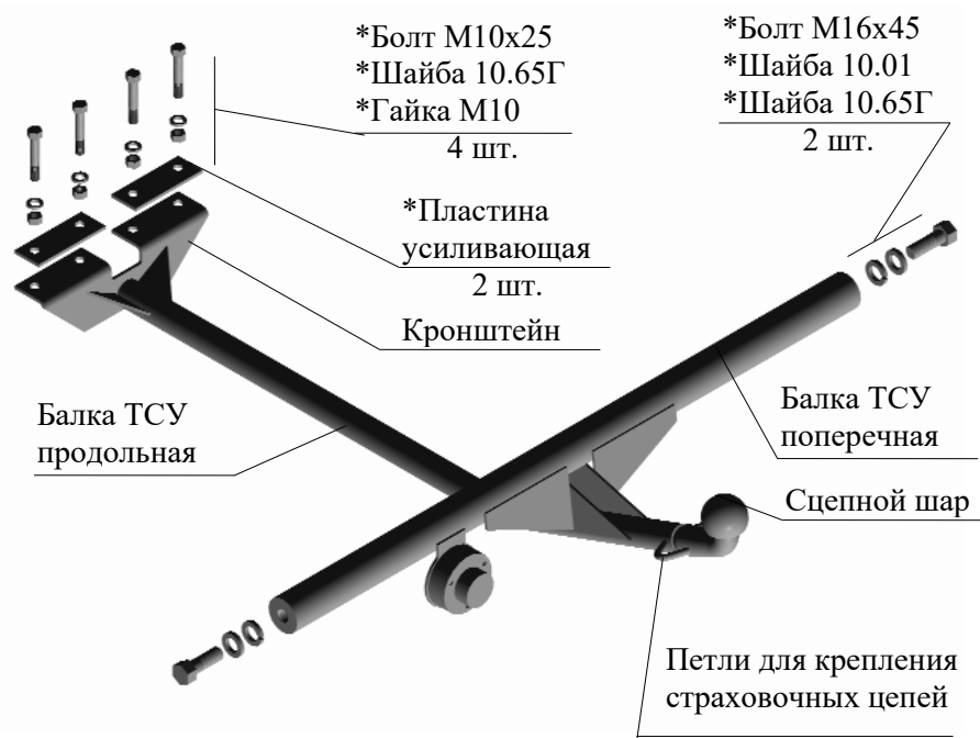
Рис.1 Тягово-сцепное устройство ТСУ 2105

Примечание: детали, помеченные * входят в пакет комплектующих